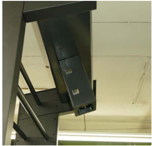
Das PQA-S-V5-Kamerasystem für die Inline-Qualitätsinspektion und die Inline-Farbmessung und -regelung sowie die automatische Registersteuerung.

Ein wichtiger Punkt für Thorsten Pauli und sein Team ist eine umweltgerechte Druckproduktion. Daher zählen bei Braun Druck & Medien zum Beispiel der Einsatz FSC-zertifizierter Papiere, der Einsatz von biologischen Druckfarben, die Verwendung von Reinigungsmitteln und Zusatzstoffen auf pflanzlicher Basis und die reduzierte Verwendung von Isopropanol zum Alltag. Die optimierte Abfallverwertung ist selbstverständlich. Solarpaneele auf dem Dach unterstützen zudem bei der Stromversorgung.