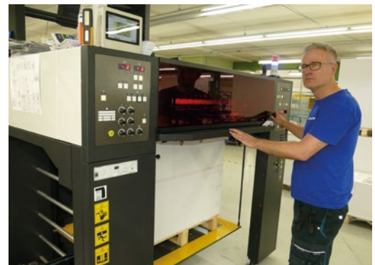
Schnell zum neuen Job: Die neue Komori GL-837P LED besticht unter anderem durch A-APC + Parallel Makeready: Druckplattenwechsel, Gummituchreinigung, Farbprofilaufbau sowie die Voreinstellungen für Luft und Register laufen mithilfe von Parallel Makeready simultan in gerade einmal zwei Minuten.